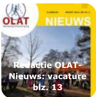
Redactie OLAT- Nieuws: vacature blz. 13