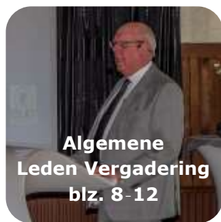
Algemene Leden Vergadering blz. 8-12