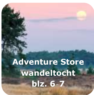
Adventure Store wandeltocht blz. 6-7