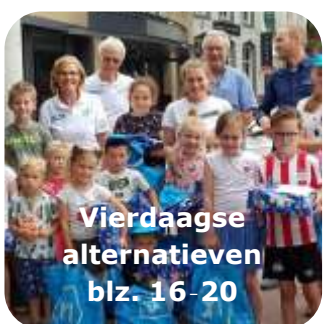
Vierdaagse alternatieven blz. 16-20